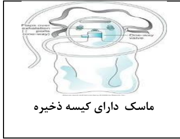
ماسک دارای کیسه ذخیره