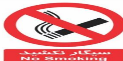
علامت سیگار نکشیدن را بالای تخت مددجو نصب کنید