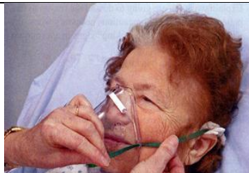
نوار فلزی روی پل بینی را فشار دهید.