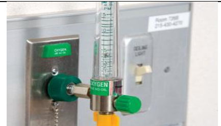
اکسیژن را به مقدار دستور داده شده تنظیم کنید.