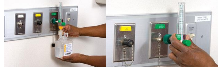
سیلندر اکسیژن و مانومتر را چک و بررسی کنید (از نظر پر بودن کپسول و عدم نشتی و وجود آب مقطر در سیستم مرطوب کننده)