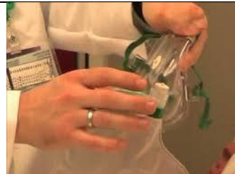
جریان اکسیژن را از انتهای ماسک کنترل کنید.