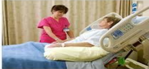
مددجو را در پوزیشن نیمه نشسته قرار دهید.