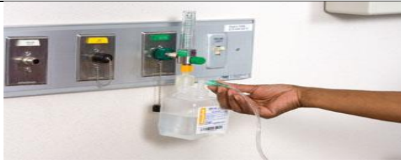
با باز کردن شیر اکسیژن، لوله و مسیر عبور اکسیژن را از نظر انسداد بررسی کنید.