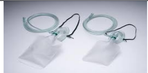
ماسک را با اندازه مناسب انتخاب، به مانومتر وصل کنید.